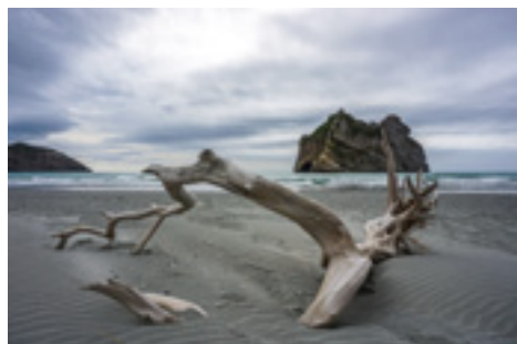
Plage néo-zélandaise de Wharariki (nord de l'île du Sud).