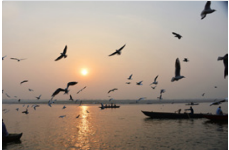
Un matin à Bénarès (ou Varanasi), ville sacrée entre toutes, dans l'Uttar Pradesh, en Inde.