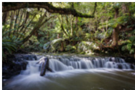
Chutes de Purakaunui dans les Catlins (Nouvelle-Zélande).

// Notre blog «Prenez Place» est né en 2014. C'est un projet qui nous trottait dans la tête depuis longtemps. Nous avons toujours été un couple un peu original, du genre à partir après le travail gravir un sommet pour s'endormir sous les étoiles. Généralement, il nous en faut peu pour être heureux ! Si nous parvenons à inciter nos lecteurs à prendre leurs chaussures de marche pour qu'ils s'évadent à leur tour, notre mission est réussie. // prenezplace.org